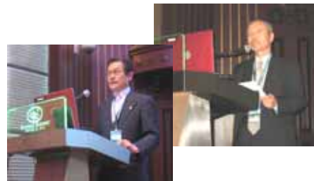
ASPAC Annual Conference 2011 マレーシア クアラルンプール

FIDIC アジア太平洋地域会員協会連合 (ASPAC) 活動 ASPAC 年次総会への参加 ASPAC 理事選出協会として ASPAC の活動を支援