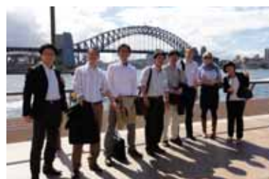
日豪交換研修 2010 オーストラリアへ 6 名の研修生を派遣

2011年 アジア地域アジア地域における DB 普及 及びアジュディケーター育成のための企画検討調査 ベトナム、スリランカ、インドネシア、フィリピン 訪問