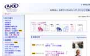
ホームページでの情報提供