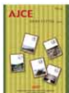
海外向け会報 発行 1 回/年