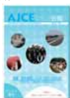
国内向け会報 発行 3 回/年